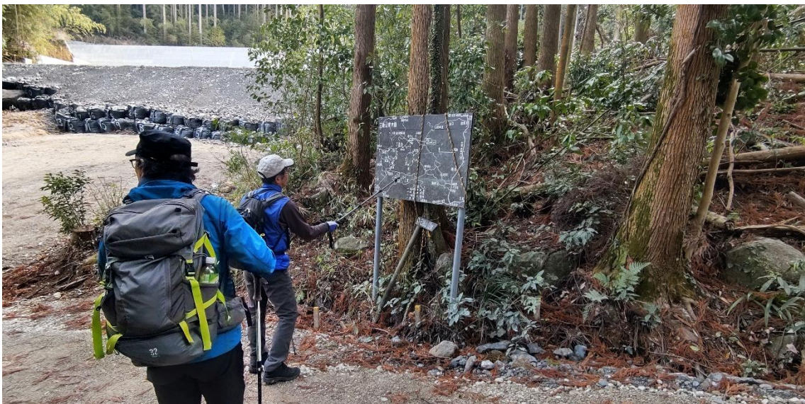
工事中の砂防ダム 10:52 ここから登山道が不明瞭 本来ならこの斜面を上って行くはずだが、工事用の林道が登山道を遮ったようだ。 三池山案内図下の道標の矢印は、林道を右に進むように指している。