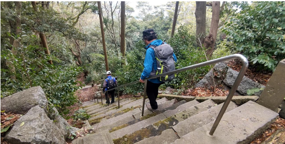
長くて急な階段を慎重に下る 13:26

この石段を下らず、巻き道になっている右側にある登山道を下ると、「三池」の地名の由来になっている三つの池を見ることが出来たらしいが……。気がついた時は遅かった！