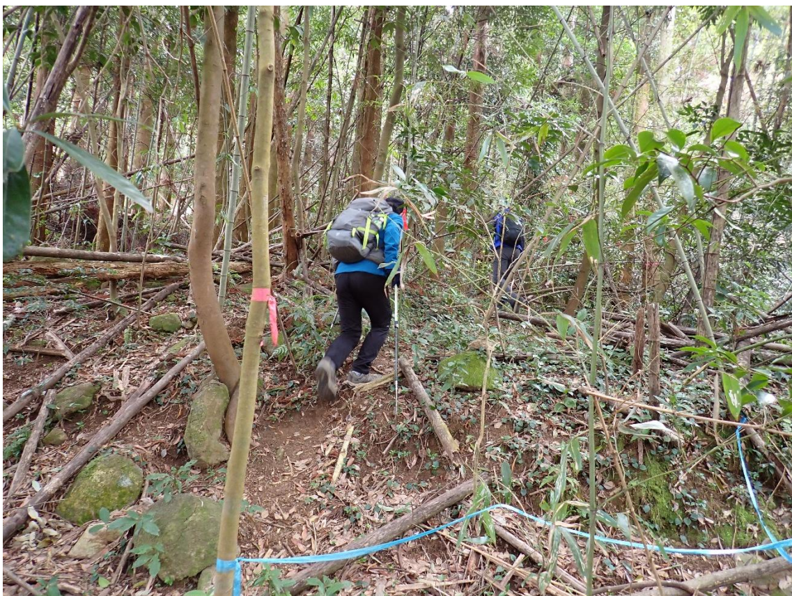
赤テープを辿り荒れた登山道を進む 10:58