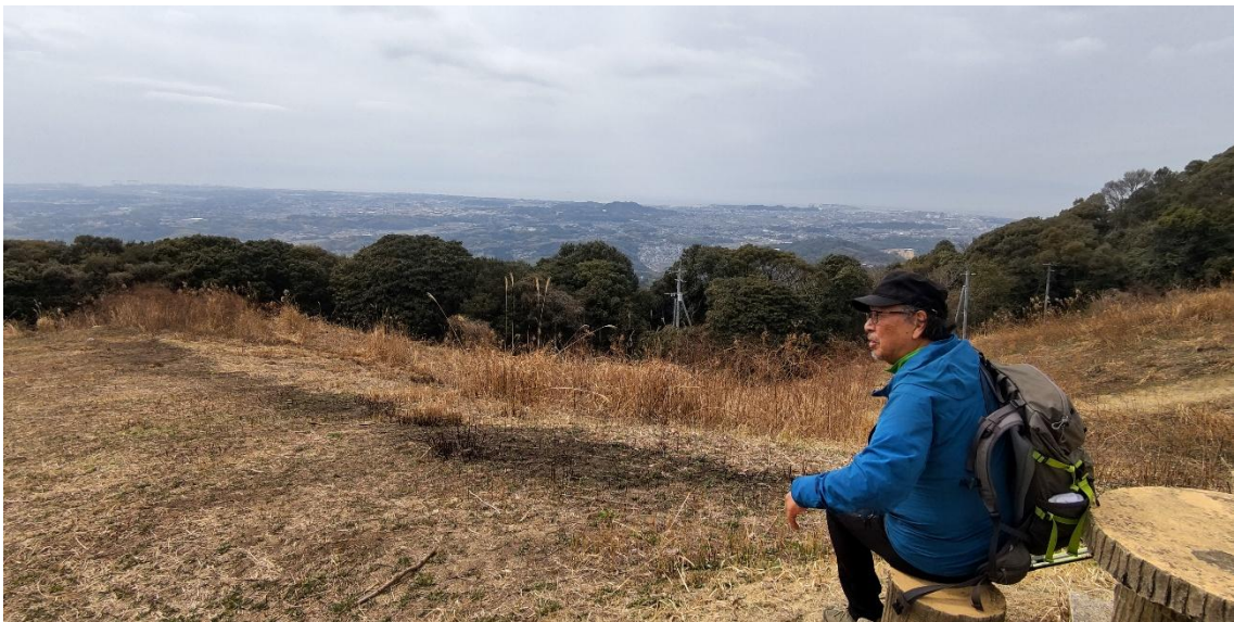
有明海を眺めながらランチタイム ~ 12:51