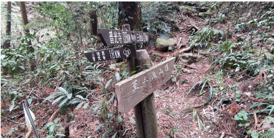
三池山への道標が現れた 11:11