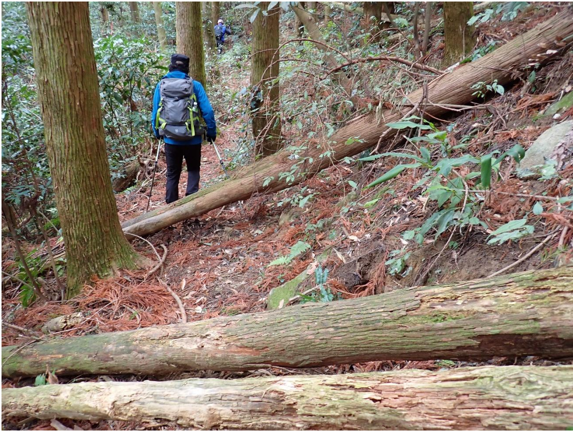
倒木の多い登山道。整備が行われていない。