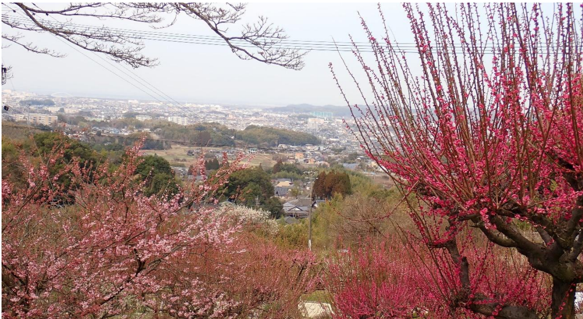
普光寺境内から臥龍梅越しに大牟田市内を眺める