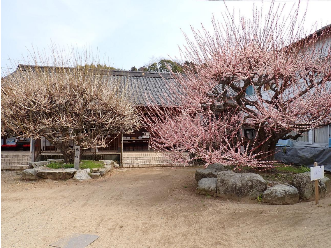
普光寺の「飛梅」 この梅の名は「八光梅」(はっこうばい)