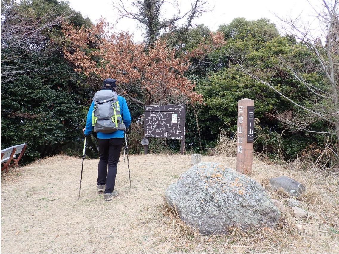
茶臼塚山 12:53 → 三池山 12:58