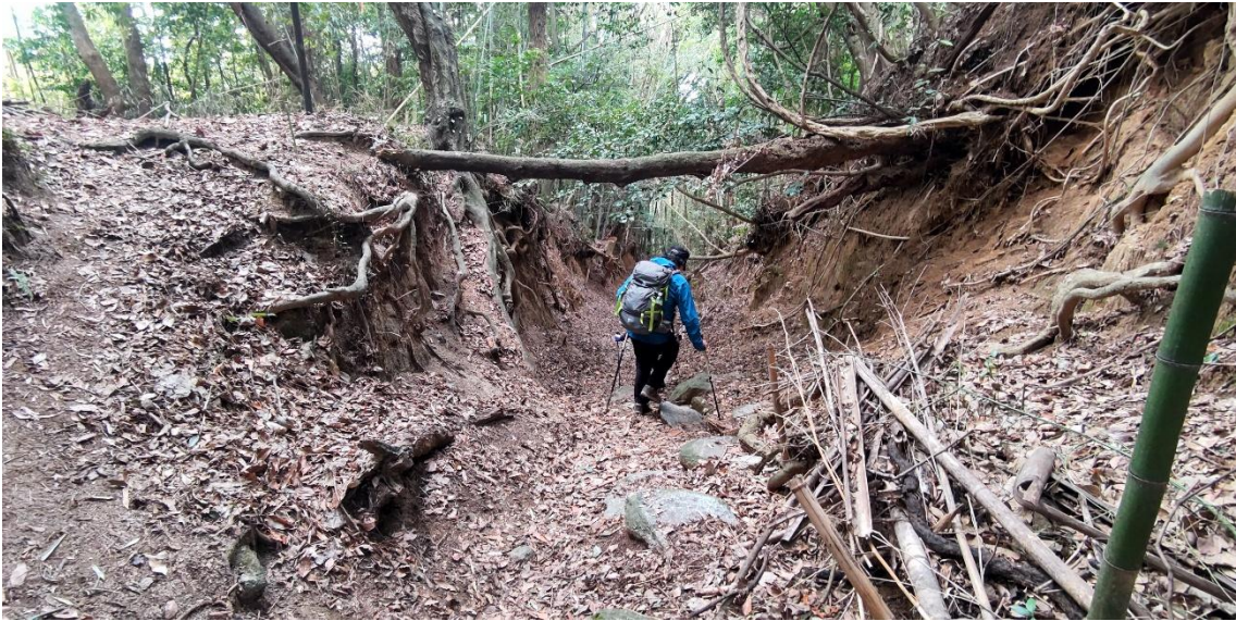
砂防ダムに近づくとつれ、土砂崩れの傷跡が痛々しい。 13:56