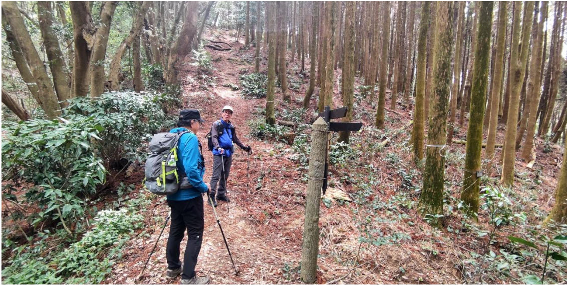
山頂まで続く尾根に出た 11:44 あと200m で山頂だ！