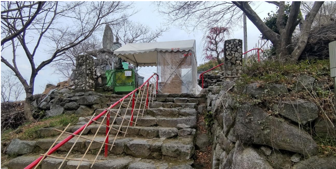
臨時に設営された関所で、500円の拝観料を支払い境内へ 10:08