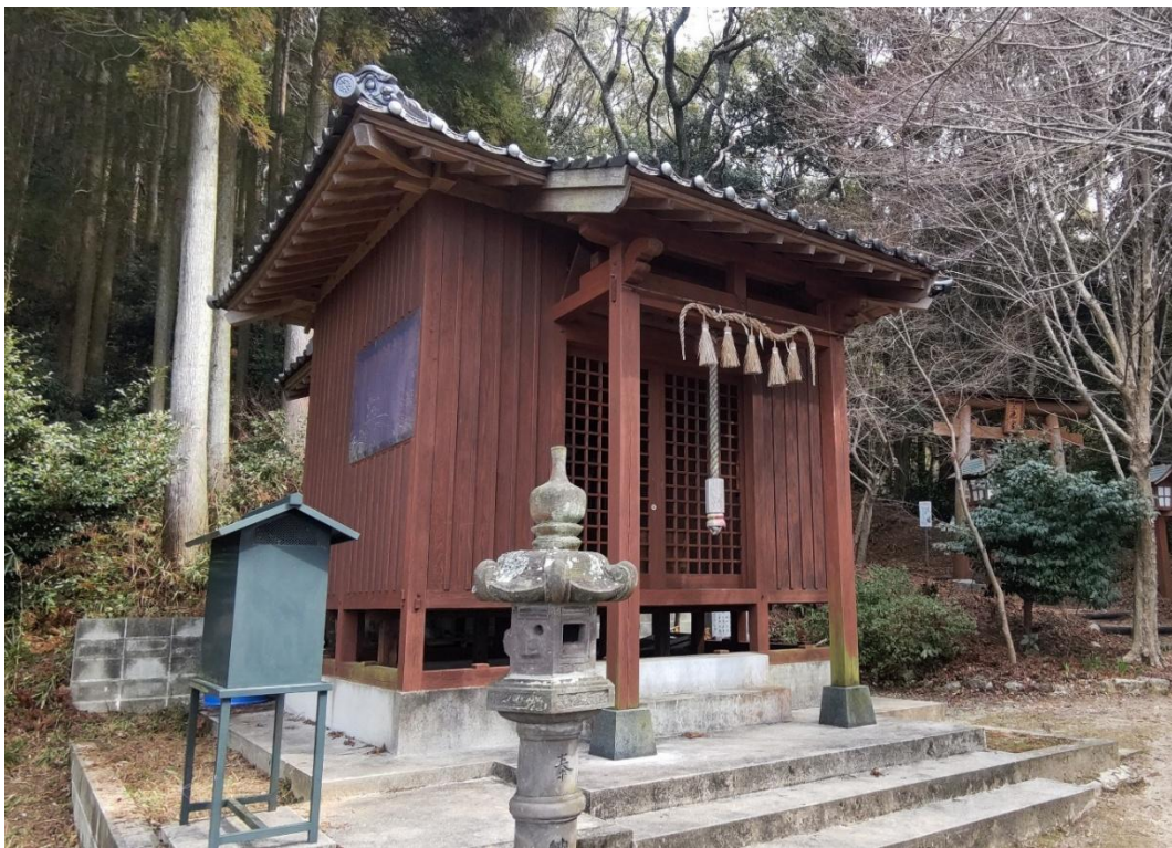
八大龍王宮 13:43 通過