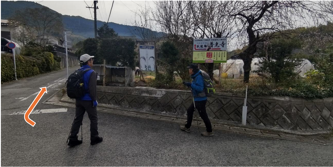
普光寺の案内標識に沿ってこの角を右に上って行く 9:50