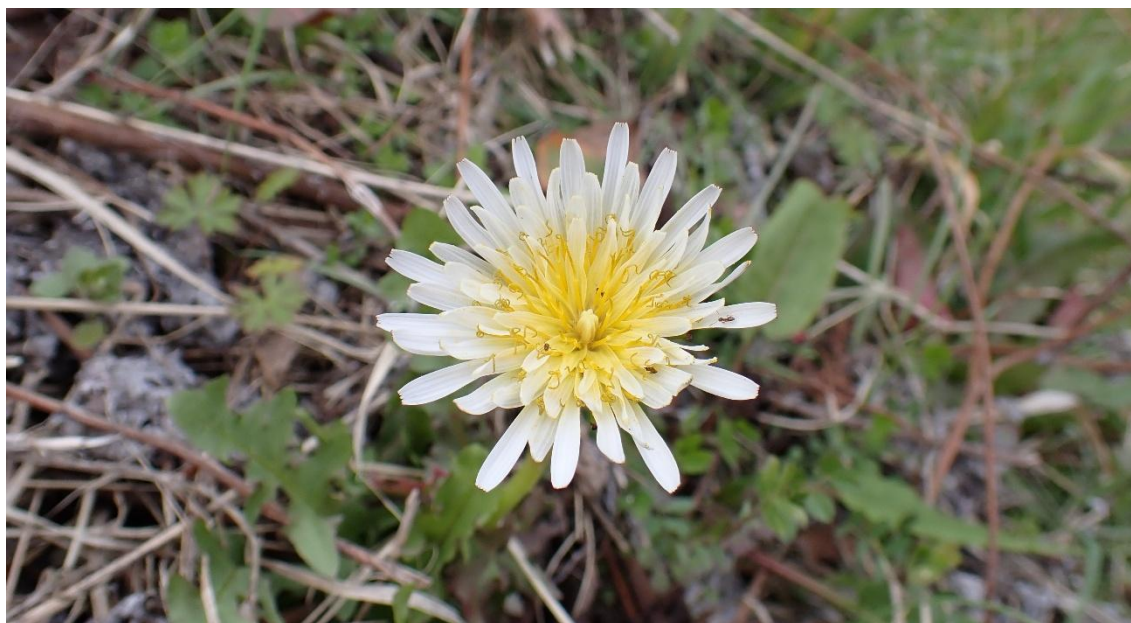
普光寺臥龍梅臨時無料駐車場 14:52 シロバナタンポポが咲いていた