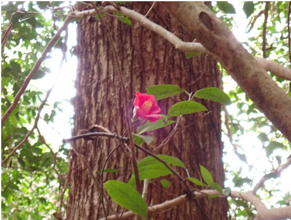
ベンチ横でツバキが一輪咲いていた 休憩後10分程進むと・・・。