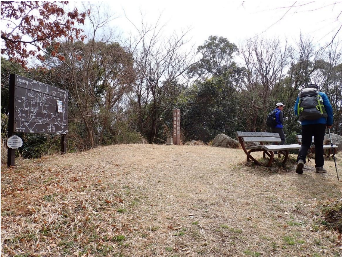
三池山(三の山) 11:50 388m 山頂で小休憩