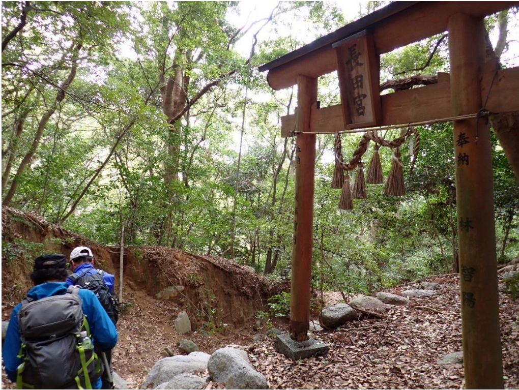
長田宮 13:37 通過