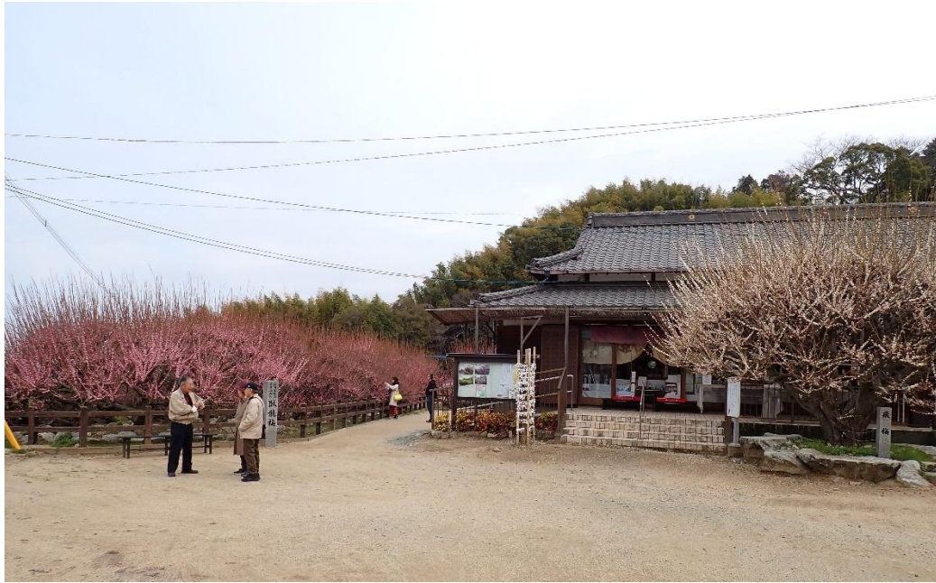
普光寺 10:12 境内には梅の香りが広がる