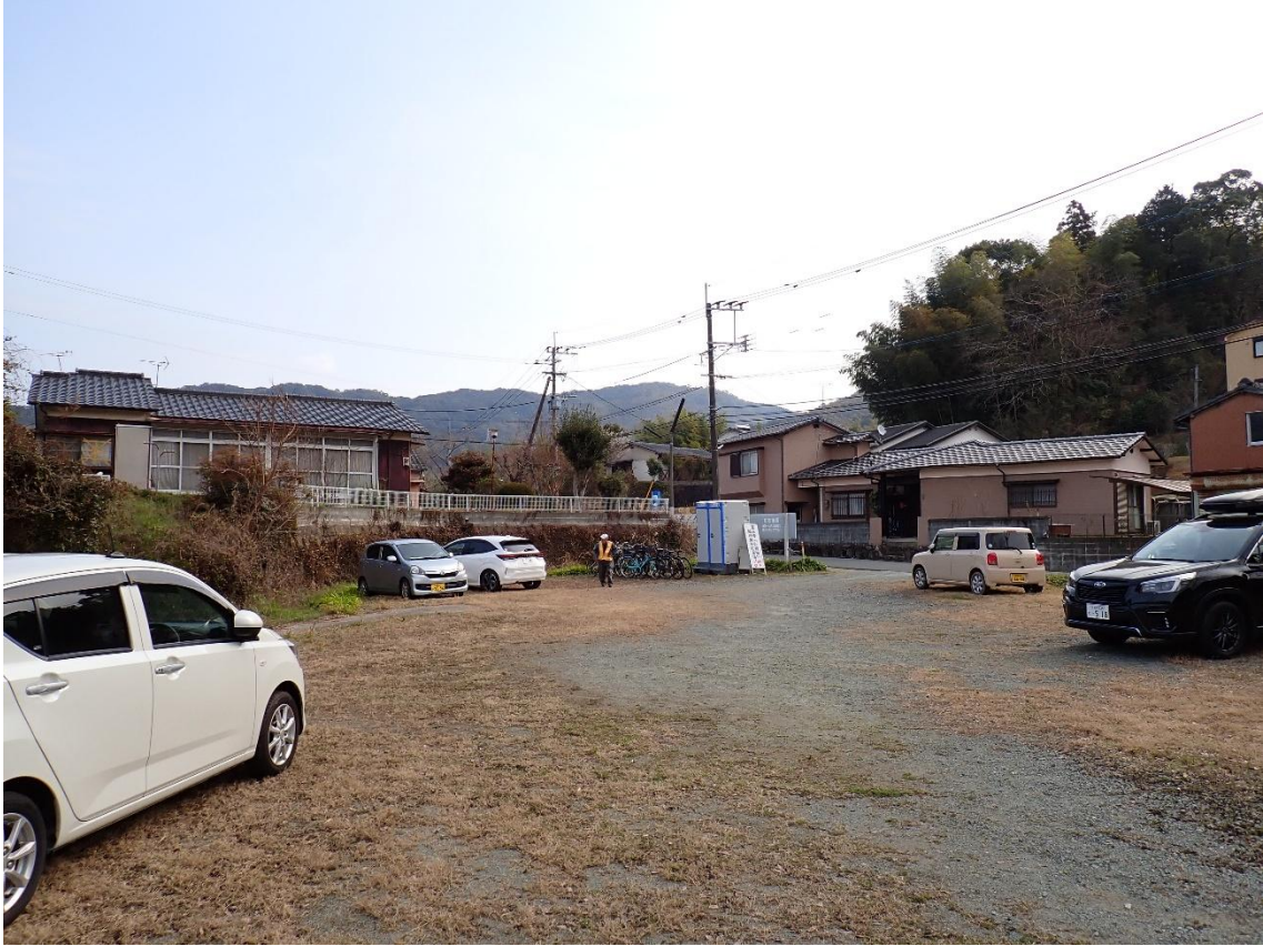
普光寺臥龍梅臨時無料駐車場 9:43 梅見物客の為に広い駐車スペースが確保されている。