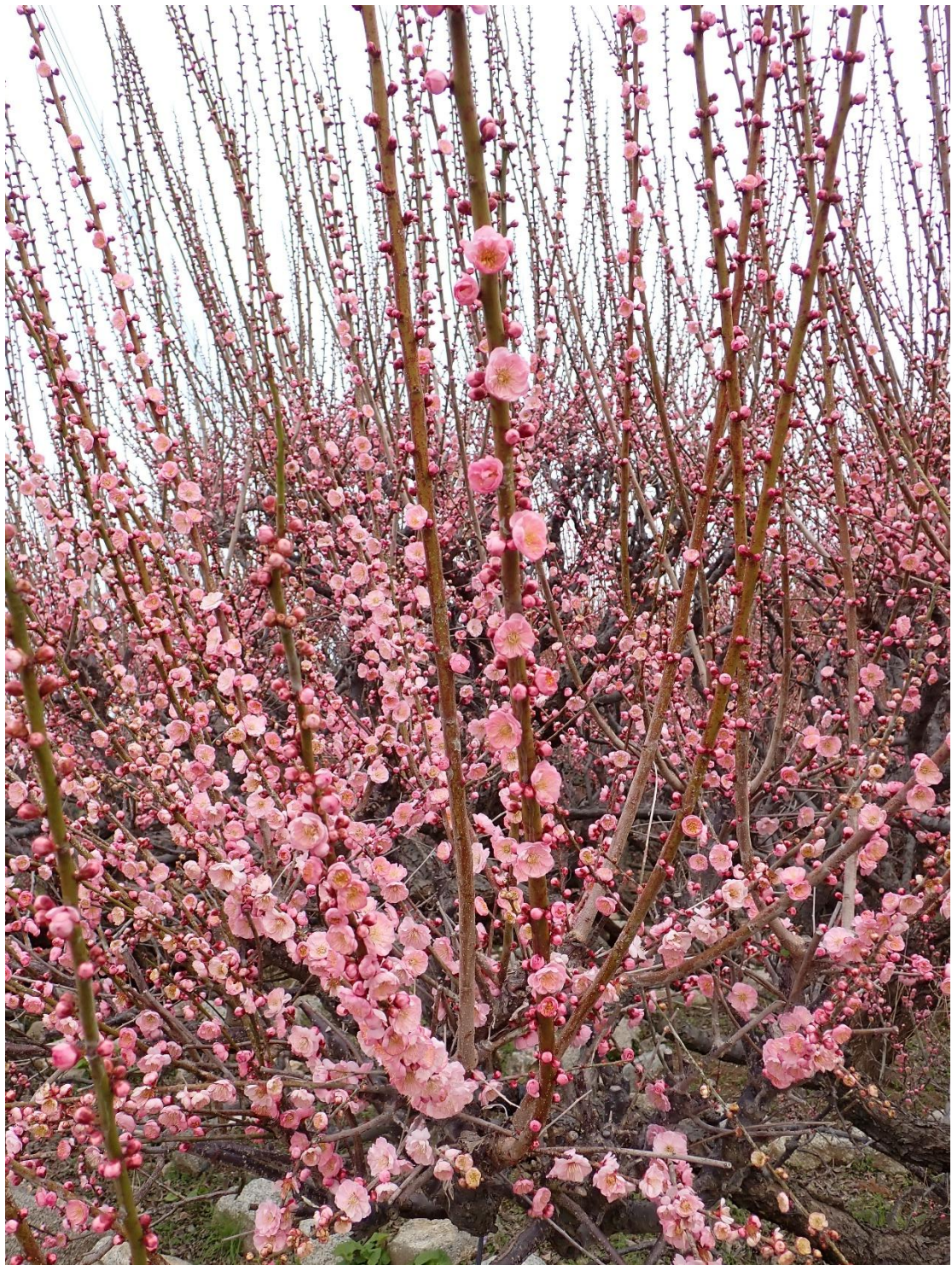
天に向かって伸びる枝 福岡県指定 天然記念物 臥龍梅(がりゅうばい)