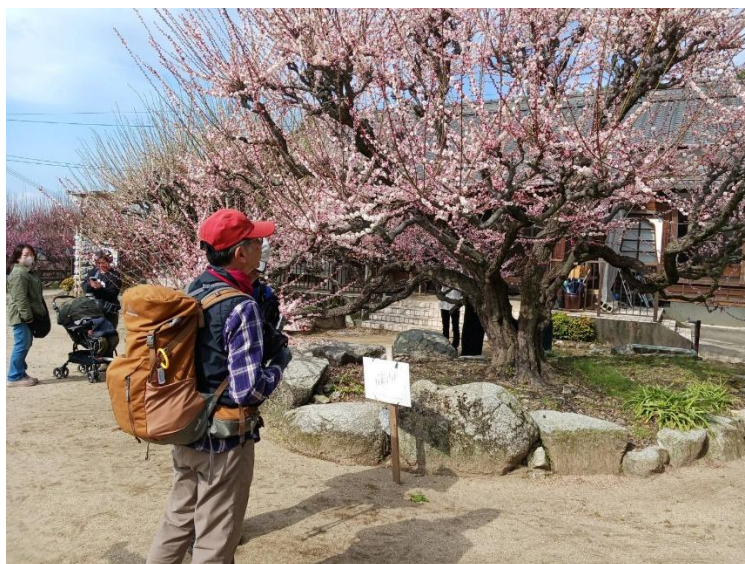
普光寺に再入場して梅観賞 20分程境内をウロウロした後、駐車場へ向かう。