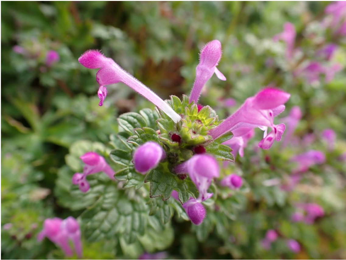
道端に咲く春の七草 ホトケノザ