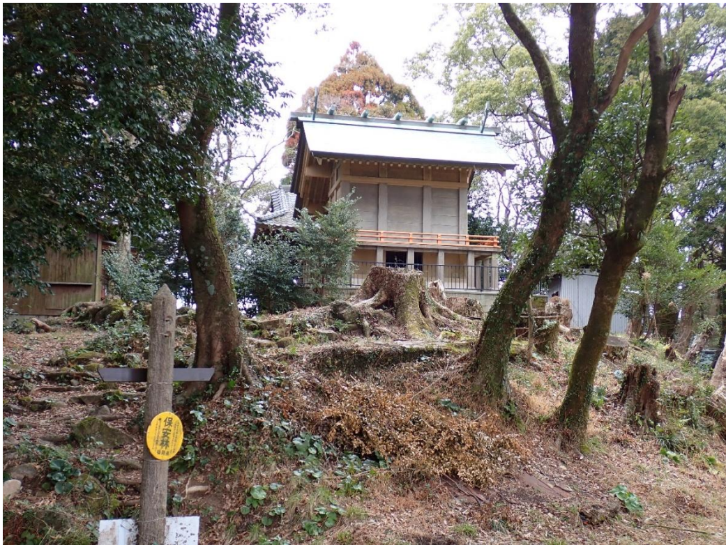
今山岳(一の山)山頂から三池宮が見える