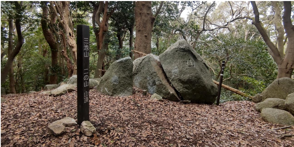
二の山 13:04 通過