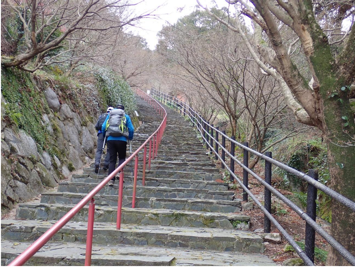
長い石段を辛抱強く 10:07