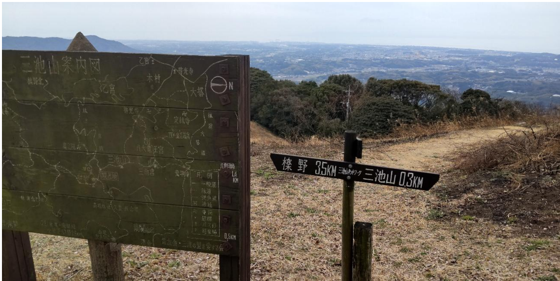
左:檮野(いちの)まで3.5km、右:三池山山頂まで0.3km