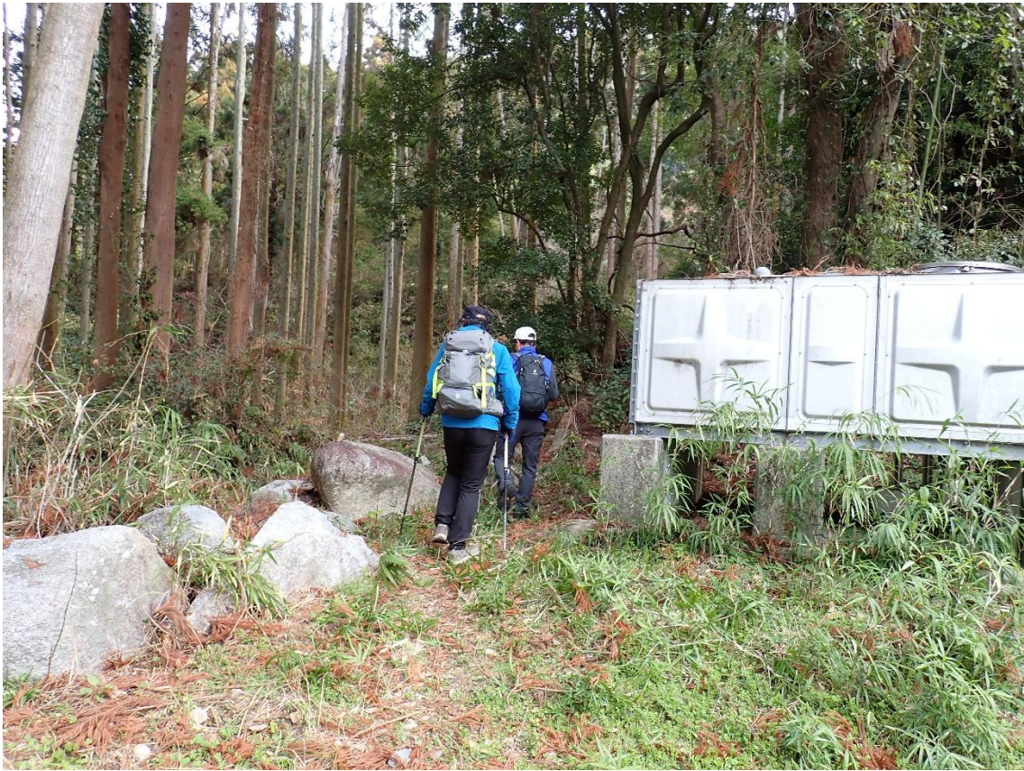
普光寺右側奥からの取り付け 10:47 臥龍梅観賞と参拝も終え三池山を目指す！