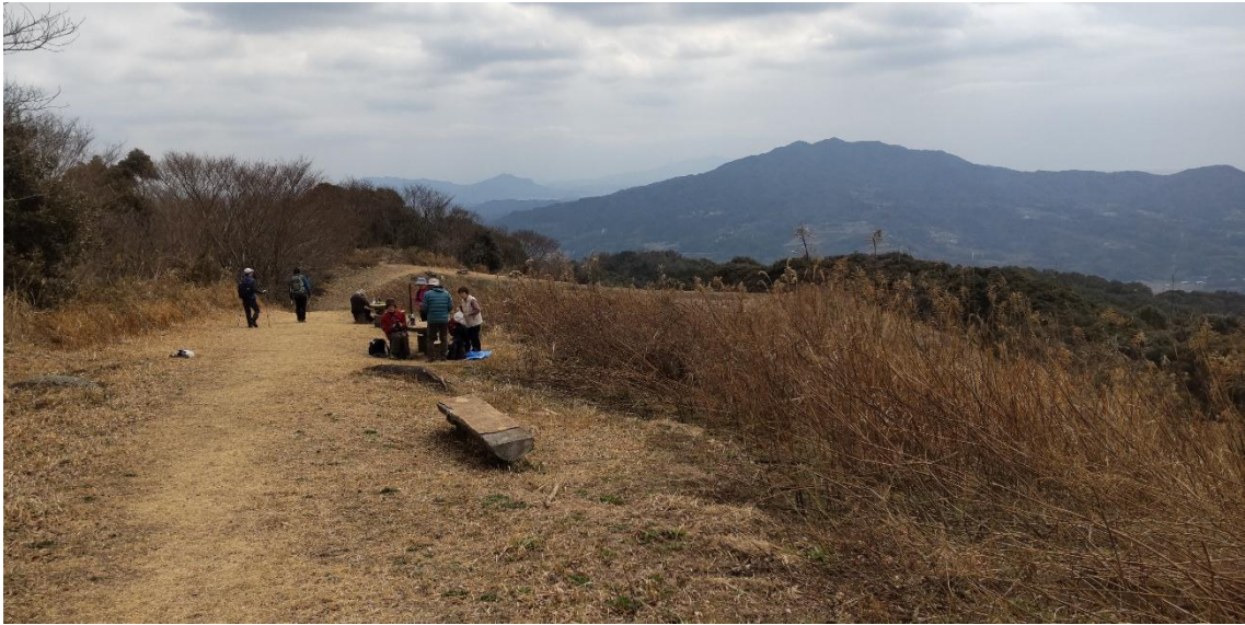
景色の良い開けた場所に出た 12:08 正面に見えるのは昨年9月に歩いた小岱山 他の登山者がベンチで昼食中