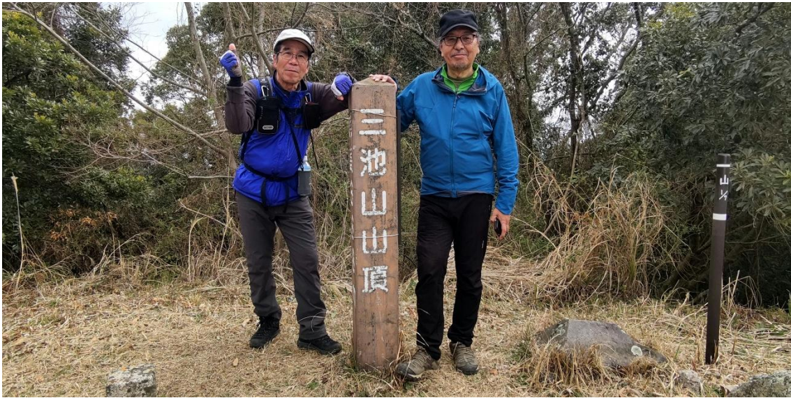
三池山でU師匠とT師匠のツーショット