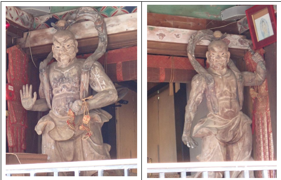
特別開扉中 普光寺仁王像（観梅期間中限定の公開だった）

この仁王像、以前はここから700m 下った所にあった山門に安置されていたとのことだった。