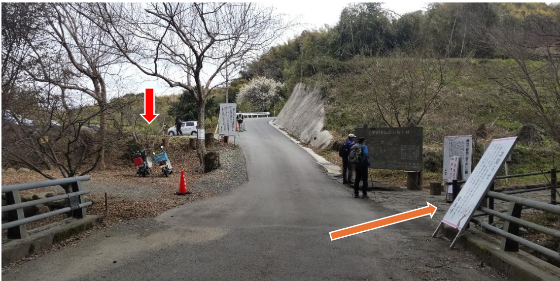
左手上に普光寺直下の駐車場(有料200円) 10:03 我々是从こから右に延びる長い階段を上り、普光寺境内を目指す！