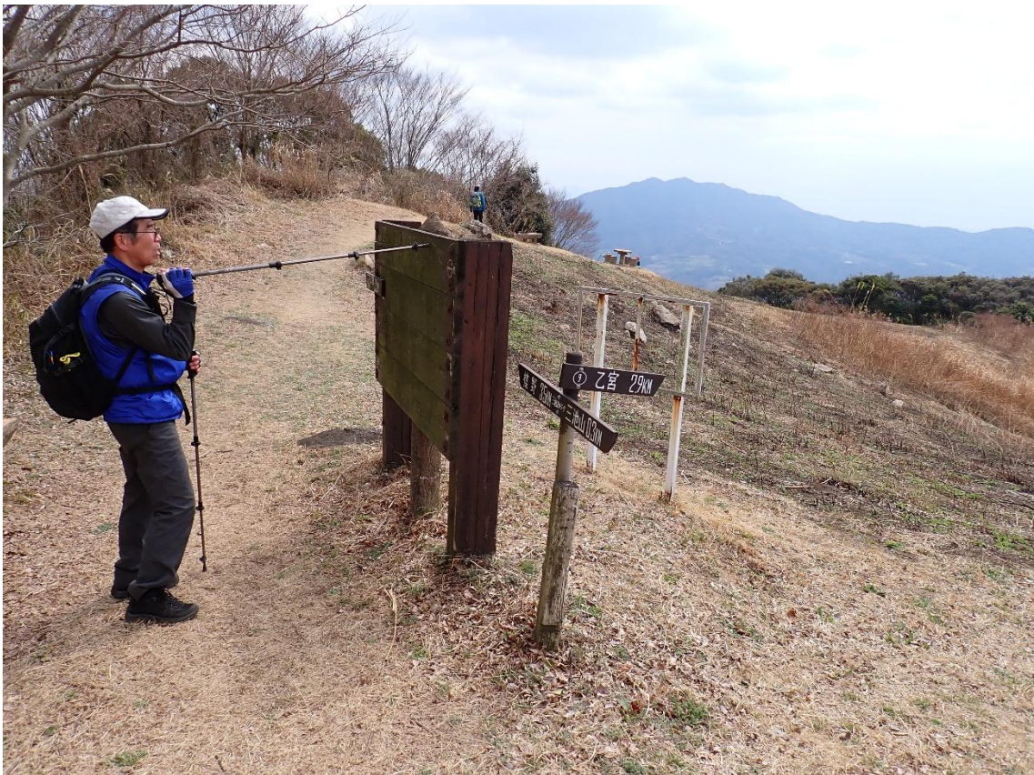
乙宮(おとぐう)への分岐 12:11 乙宮まで2.9km