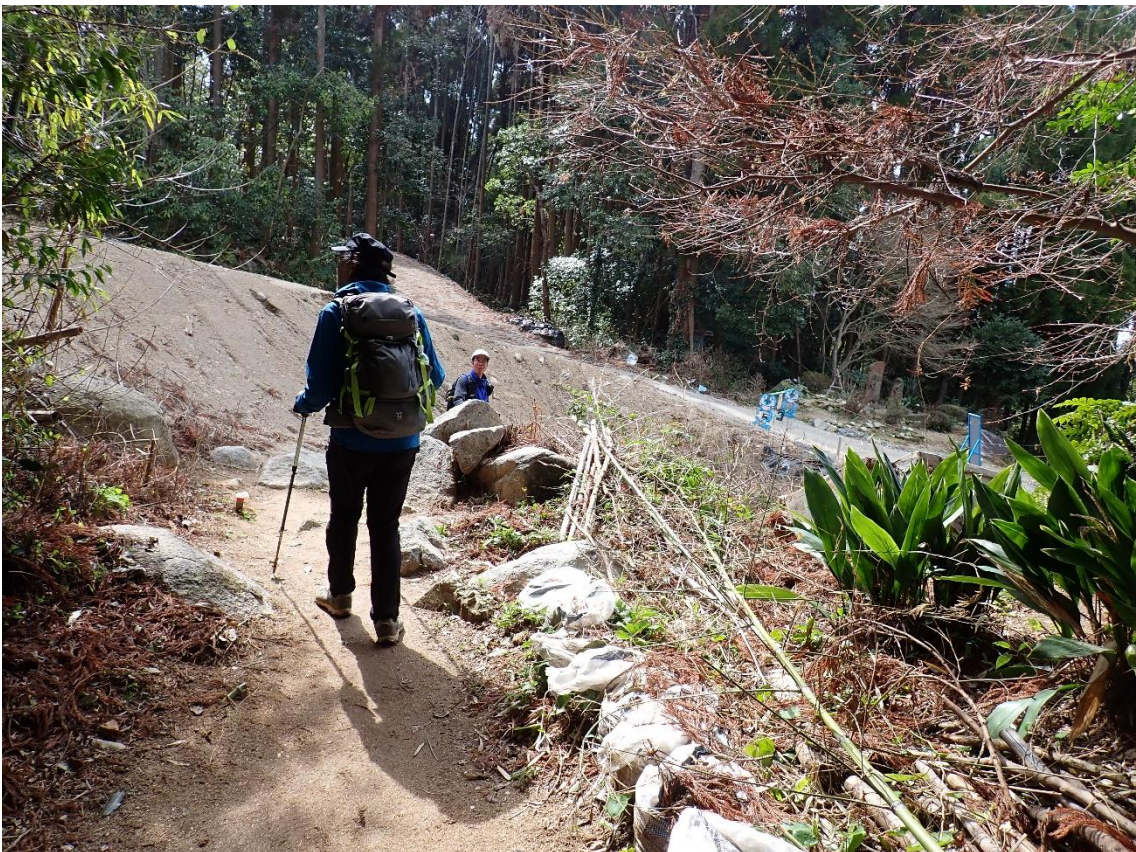
工事中の砂防ダム 14:01 無事に周回終了