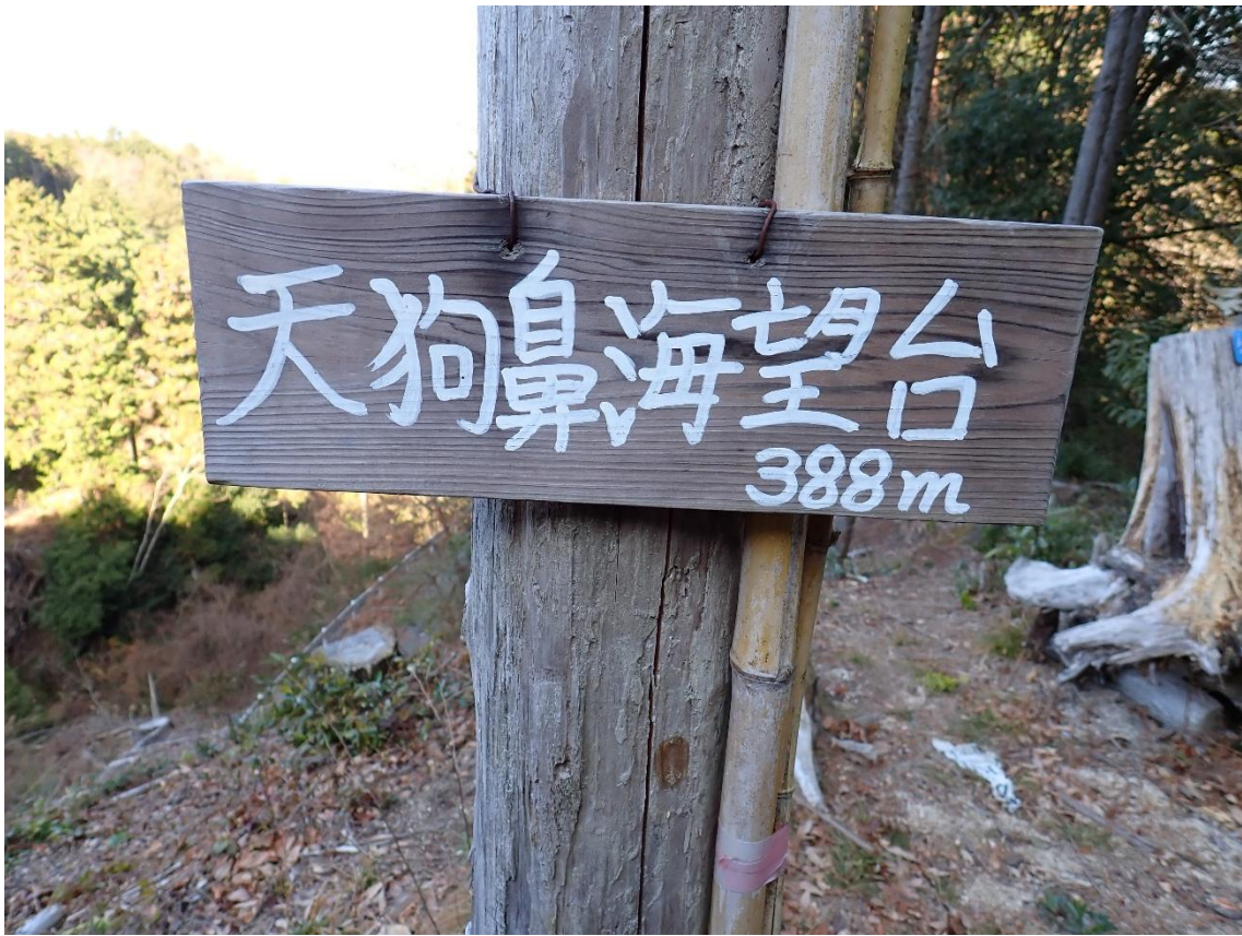
天狗鼻海望台 10:36 遠くに海が見える