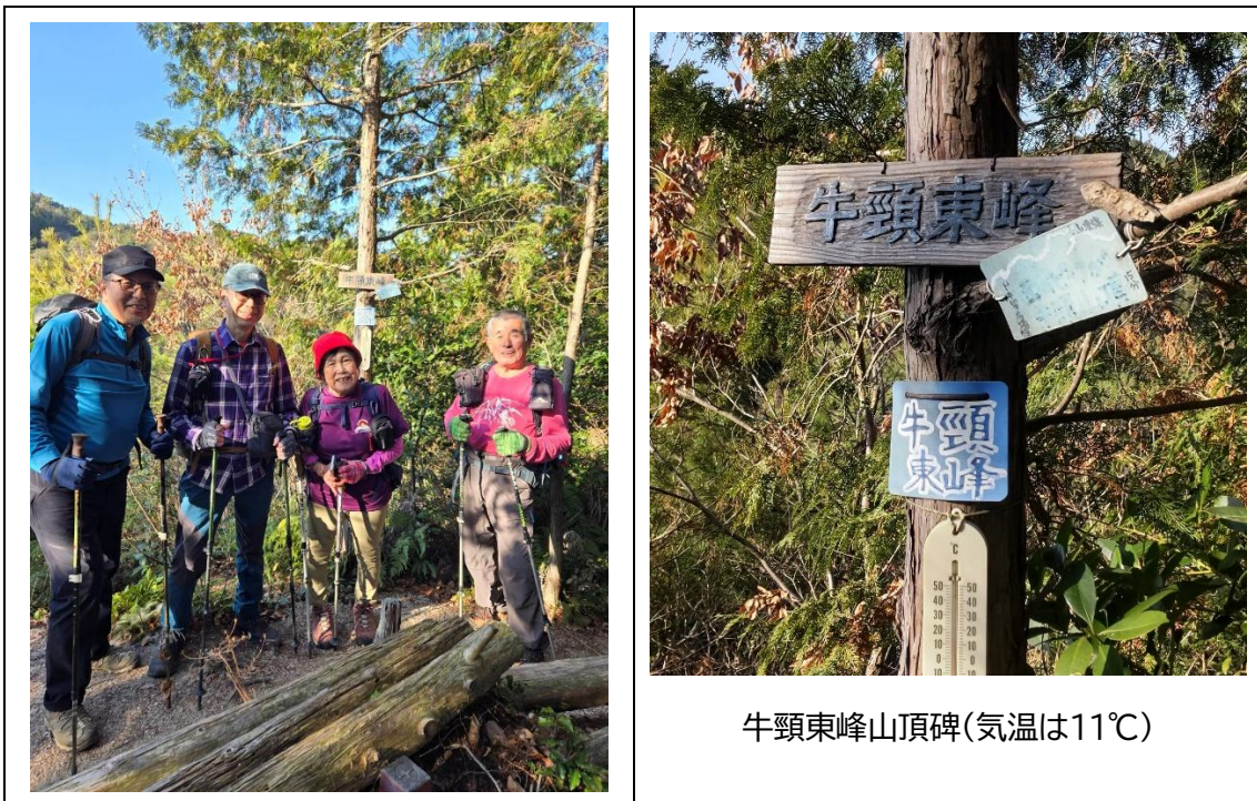
牛頸東峰山頂碑(気温は11℃)

今日は総勢5人での山歩き。ワイワイ話しながら歩いていると時間を忘れてしまう。 次は本日の第一目標である牛頸山を目指す！