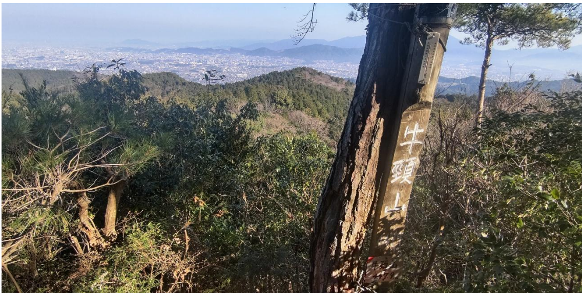
牛頸山山頂から福岡市街地を遠望