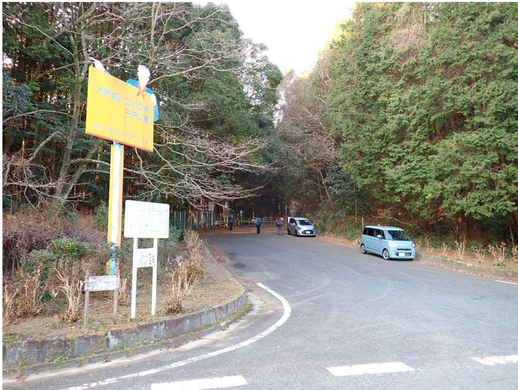
足洗川林道入口に車を停めた 8:30