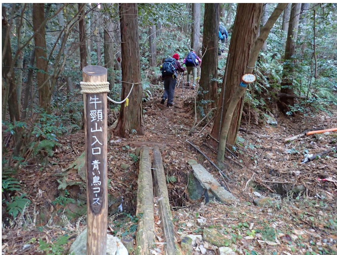
牛頸山入口(青い鳥コース) 9:07 林道を20分程歩くと青い鳥コースの入口がある