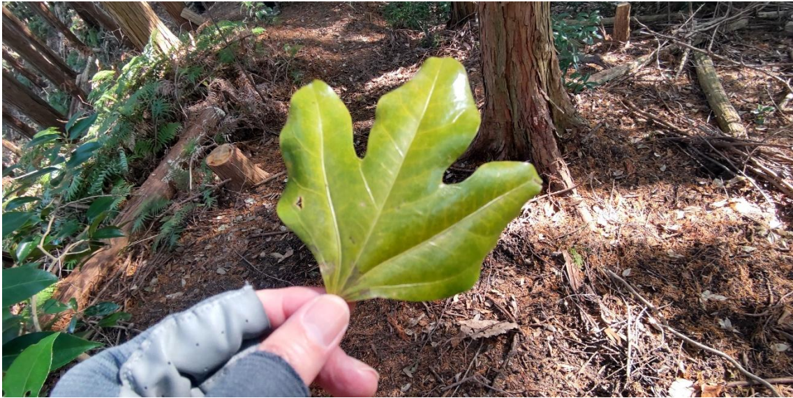
登山道に落ちていた「カクレミノ」の葉