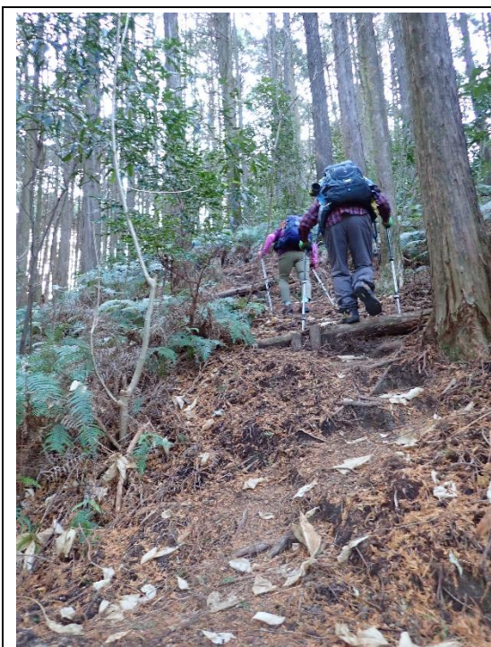
青い鳥コースに入ると急登が待っていた