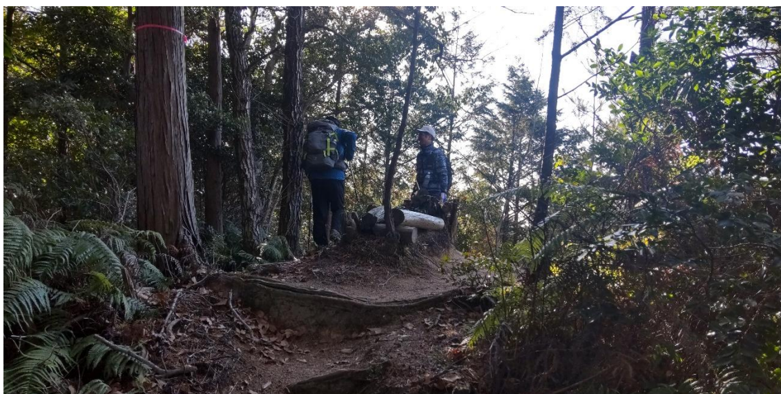
牛頸山東峰 9:45 381m