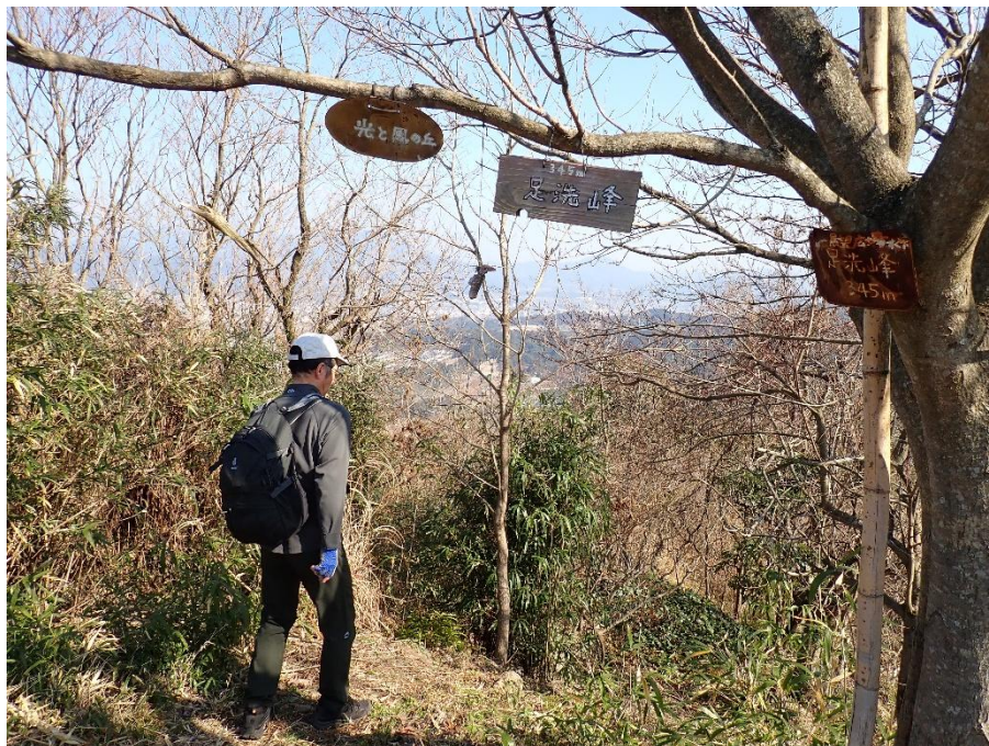
ここからは下山となるが、ここから少し急坂を下ることになる。用心、用心！