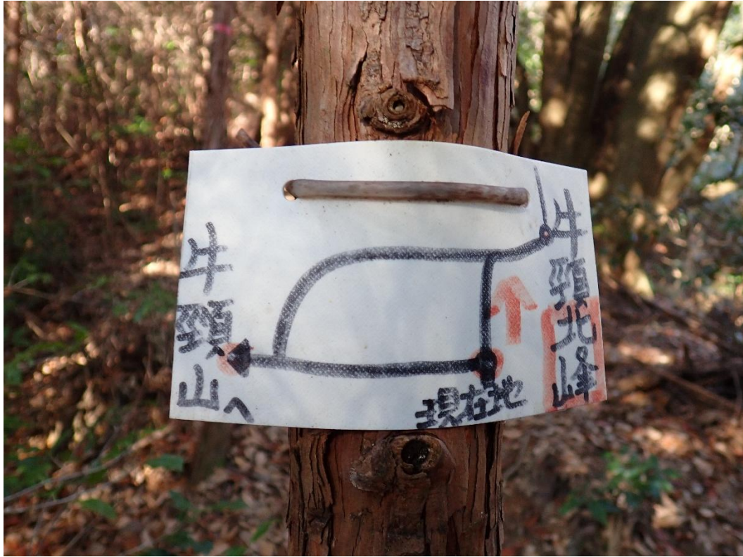
牛頸山と牛頸北峰との分岐 9:57 牛頸山を目指す！