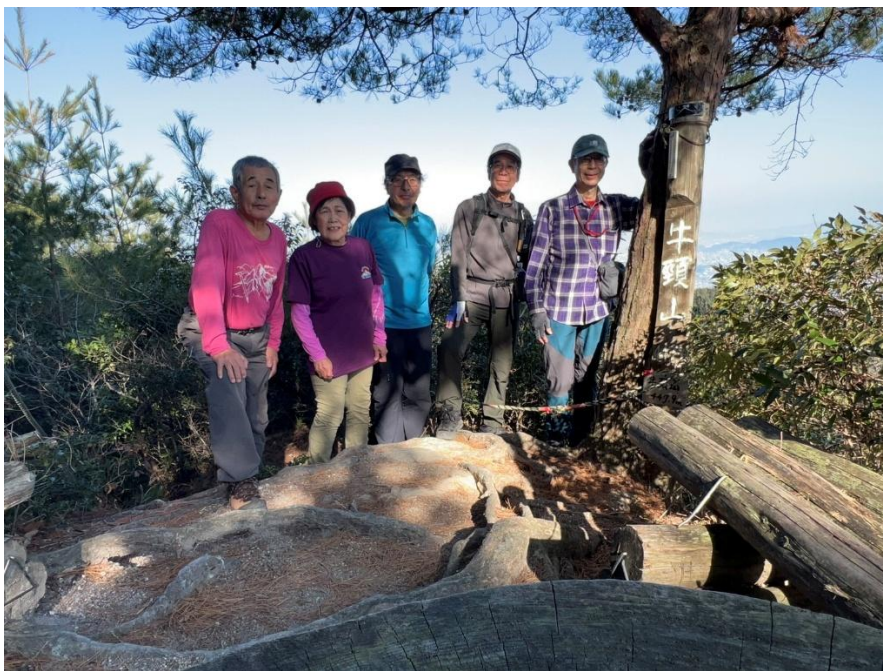
牛頸山山頂で全員集合の記念撮影

山頂には、おみくじ、ブランコ、自由ノートなどがあり、常連さんが趣向を凝らしているようだ。 山頂で休憩したが、ランチには少し早いので先に進むことにした。