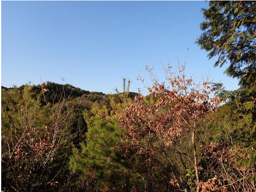
牛頸山方面を見上げる 9:47