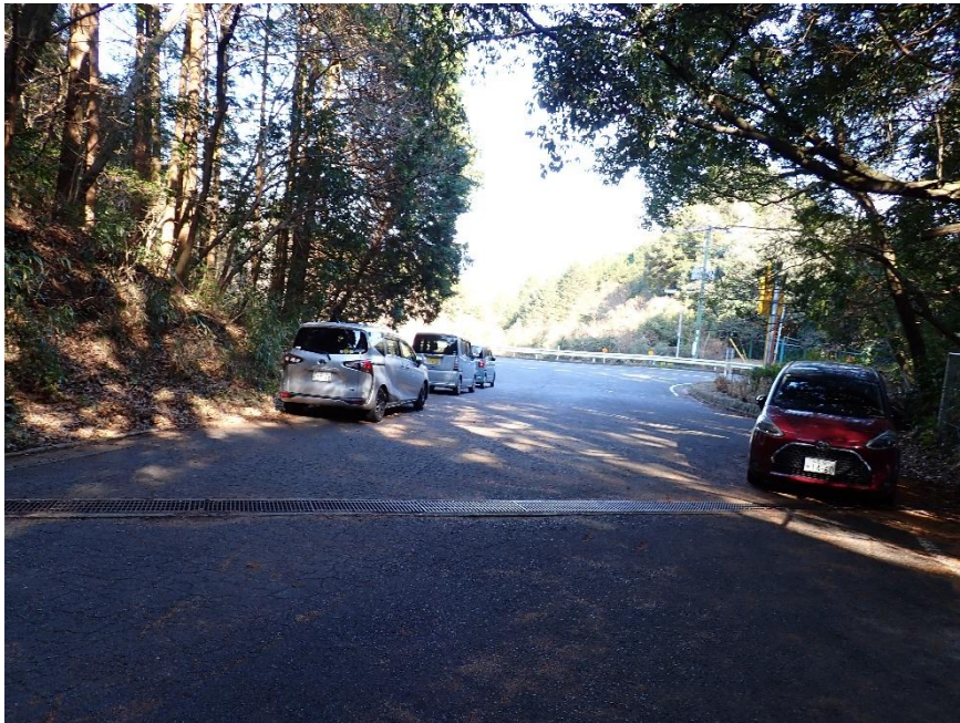
足洗川林道入口 13:04 ゴール

4時間22分の山歩きが無事に終了 低山ながら5座を縦走！ スマホの歩数計は 10683歩。T師匠、U師匠、T井ご夫妻お世話になりました。 お疲れさまでした。