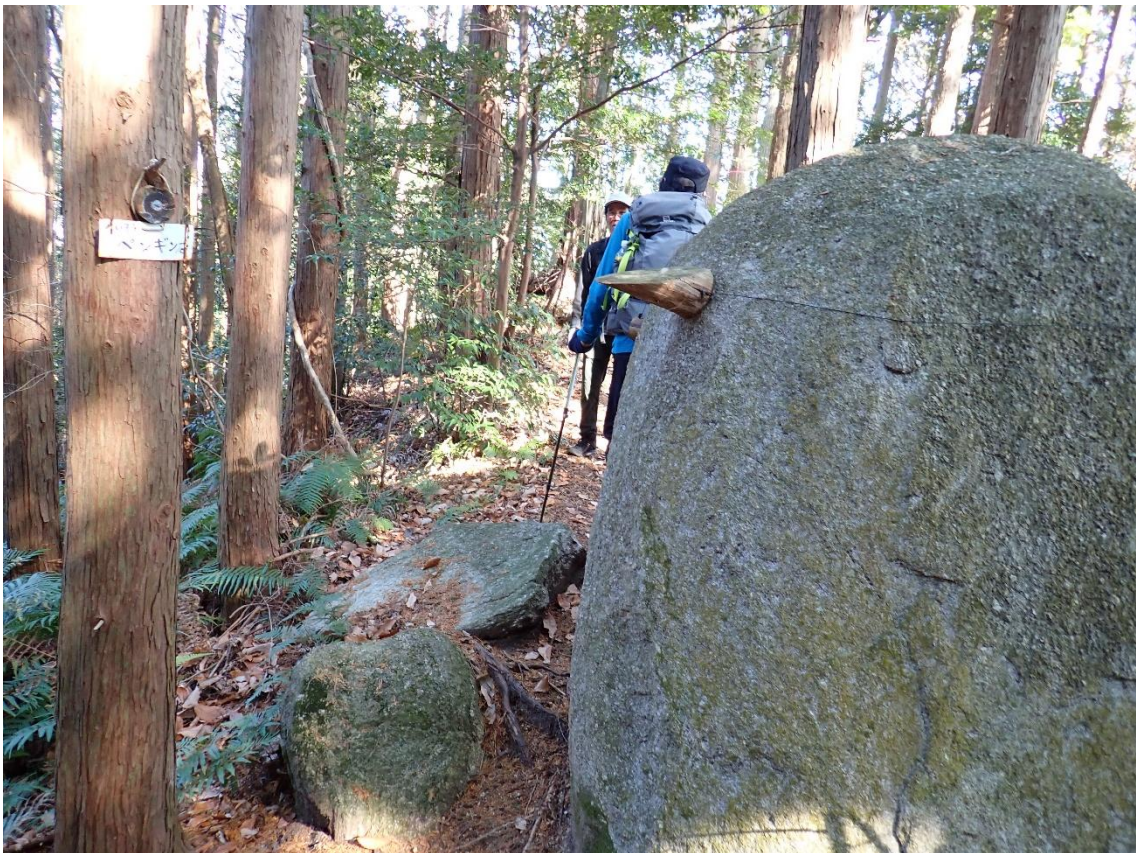
ペンギン石を通過 12:51 ヒヨコに見えるのは私だけだろうか？(笑)