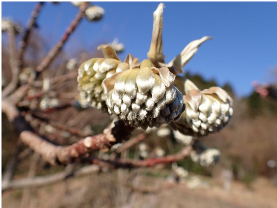
お花畑ではミツマタが開花を迎えようとしていた