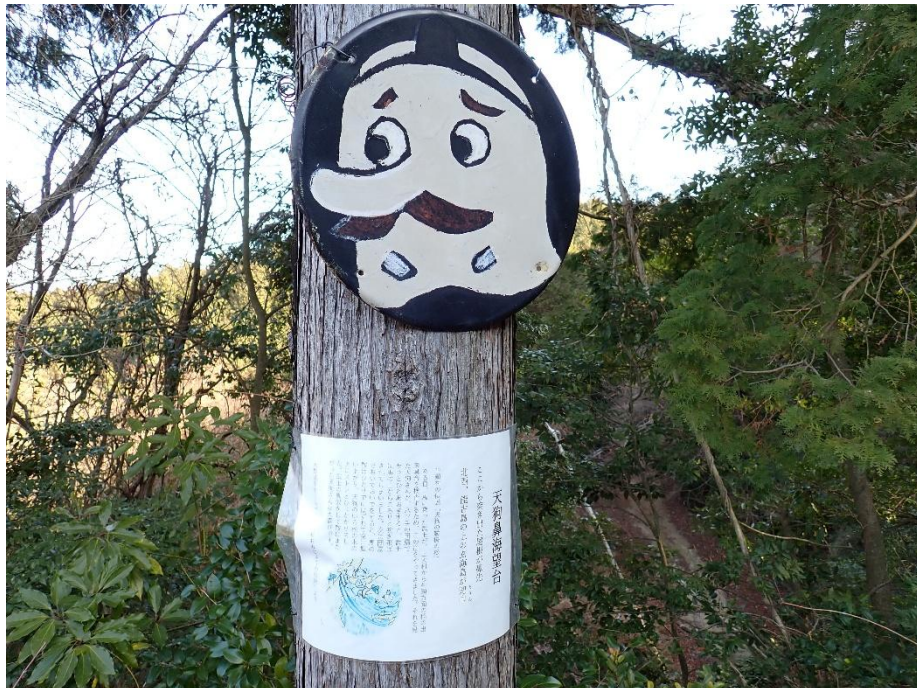
面白い天狗の看板が目立っていた。