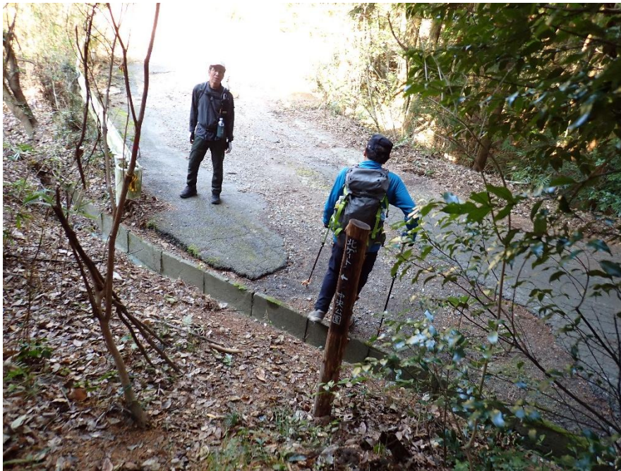
足洗川林道(足洗峰・石坂山入口) 13:00