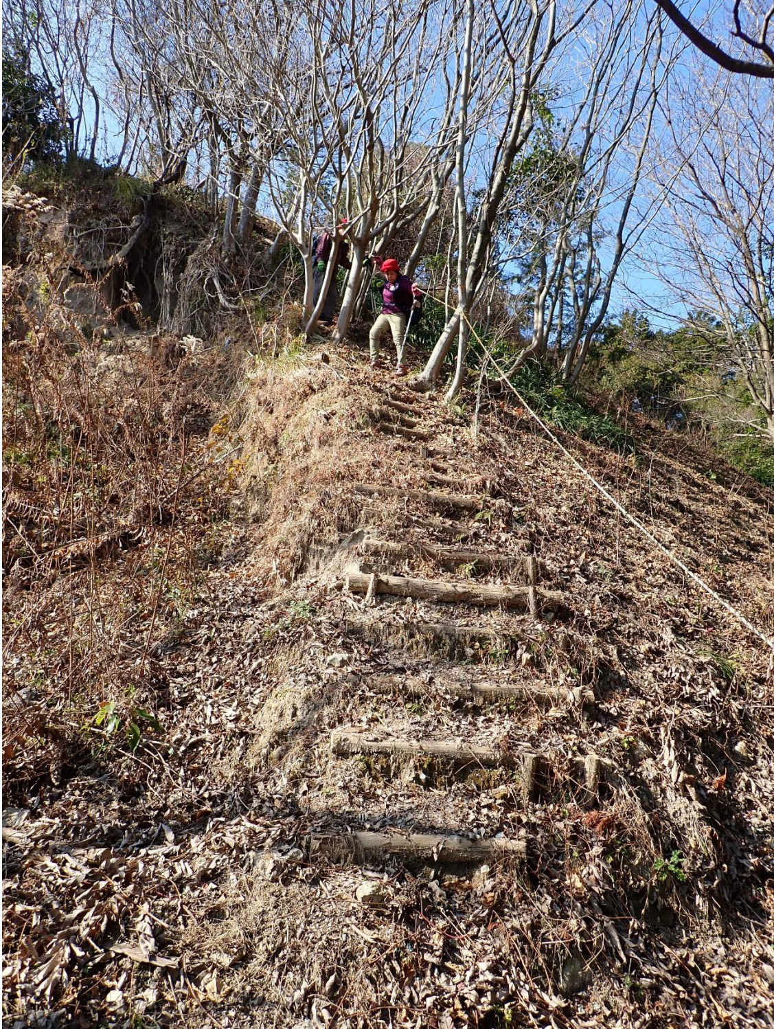
ロープを掴みながらゆっくりゆっくり下る 12:40