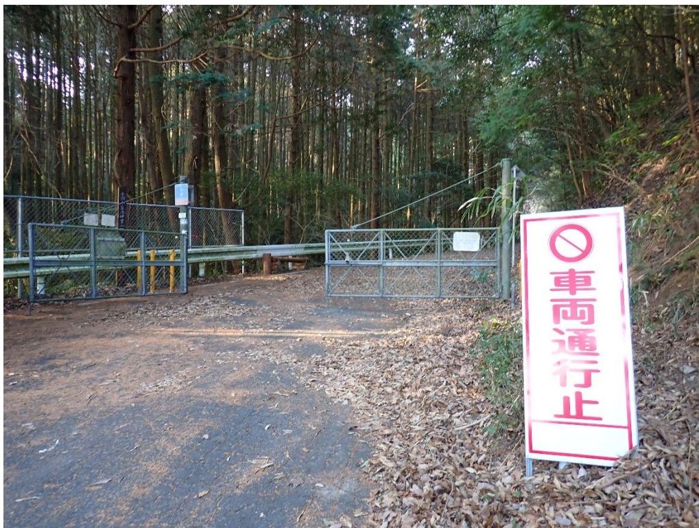
足洗川林道入口 8:42 ゲートを越えてスタート