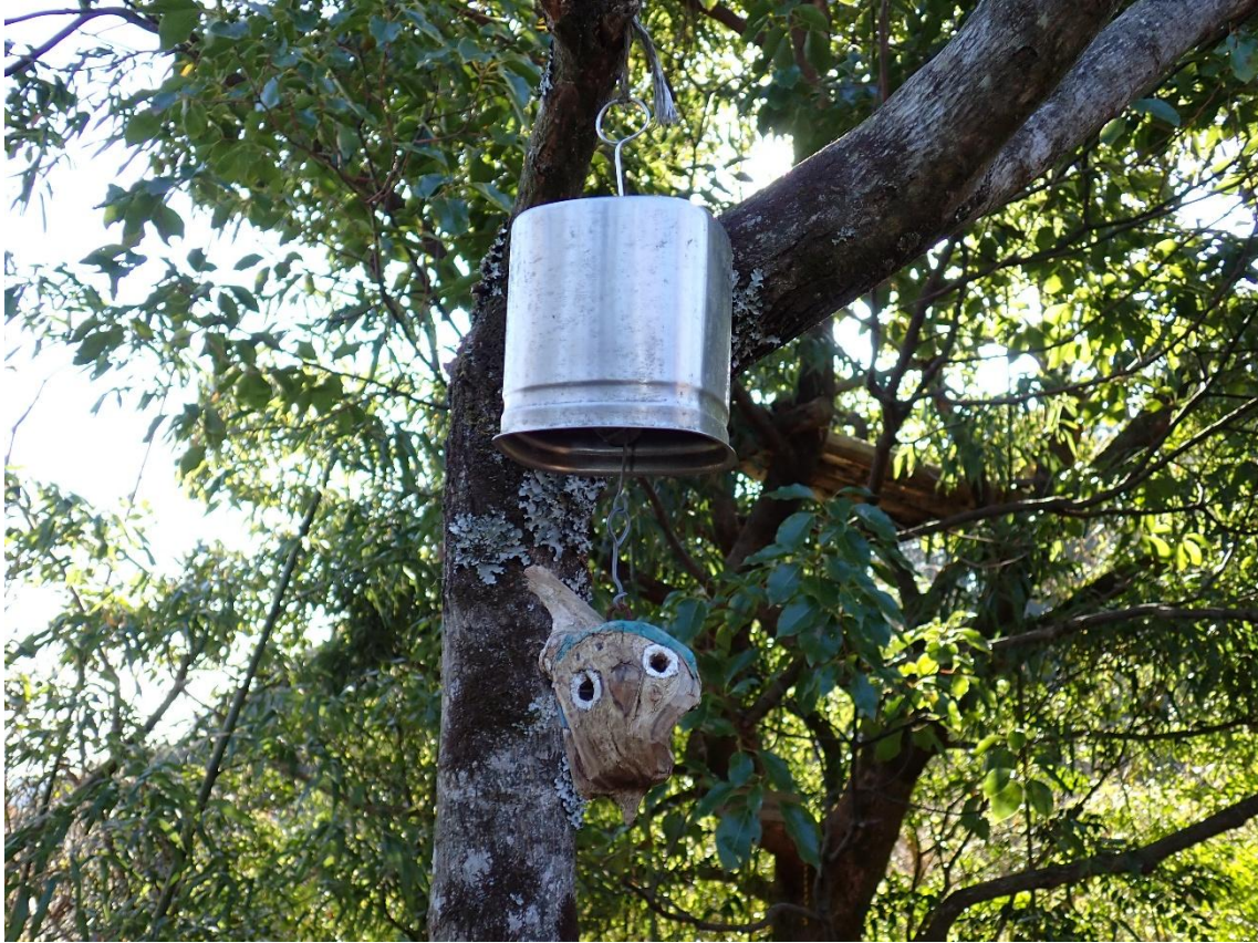
休憩場所、分岐、山頂など随所に手づくりアート作品