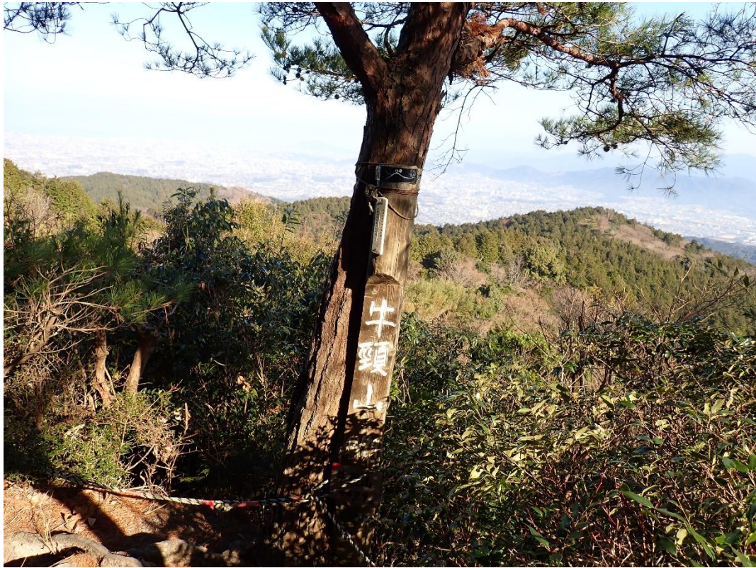
牛頸山(うしくびやま)山頂 10:17 447m