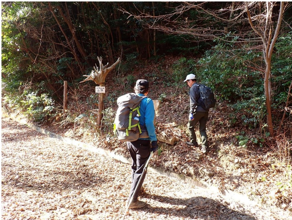
一旦林道に出るが、横断してまた登山道へ！ 10:00