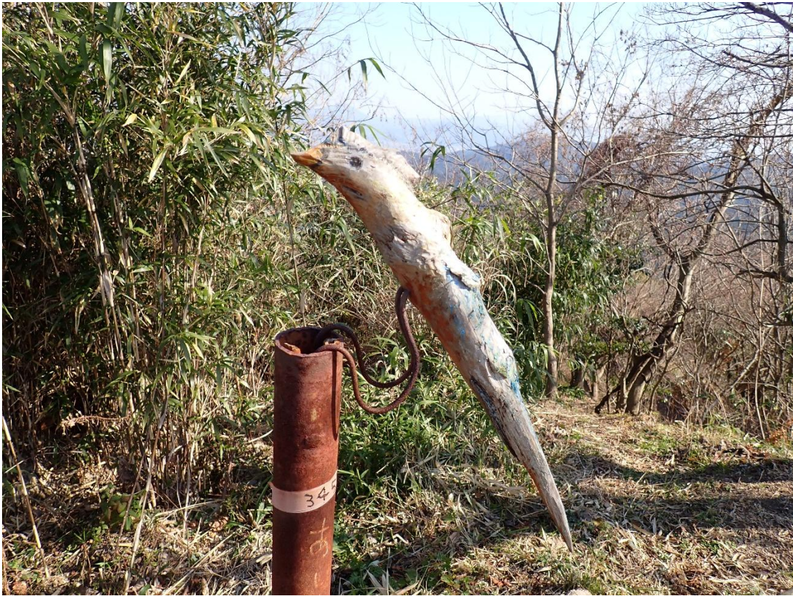
足洗峰の山頂に木の枝を利用した「鳥のアート作品」