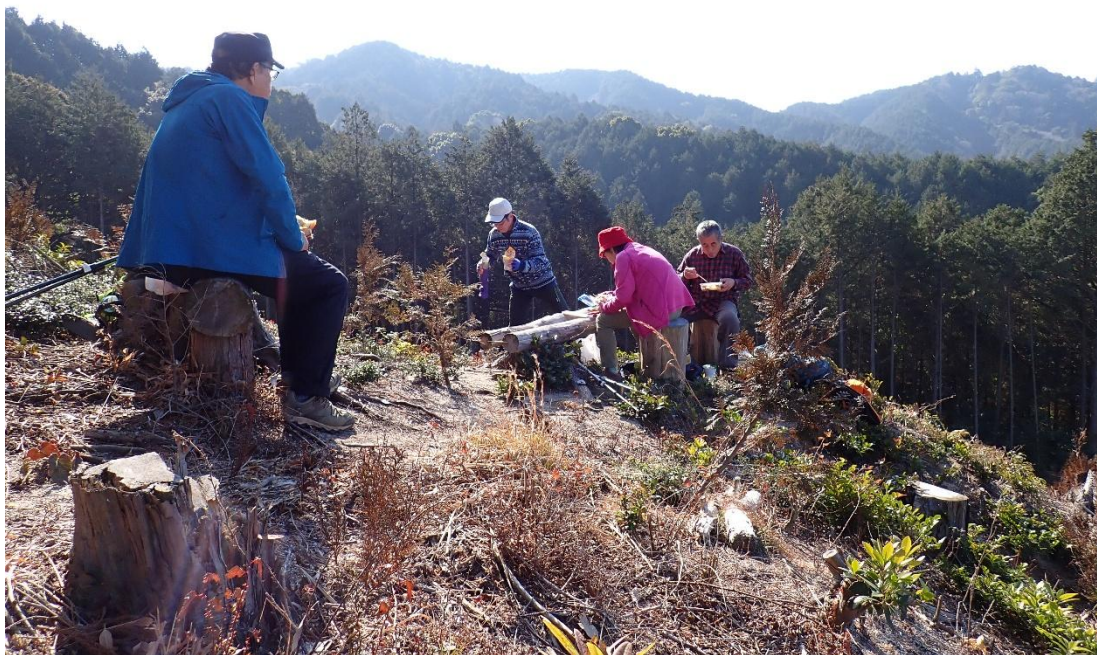
植林伐採地 11:16 <昼食> 11:49 ポカポカ陽気の中でランチタイム