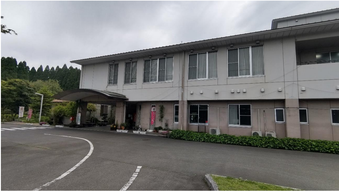
良質な天然の湯 萩の里温泉（大分県竹田市萩町） 前夜はここに宿泊