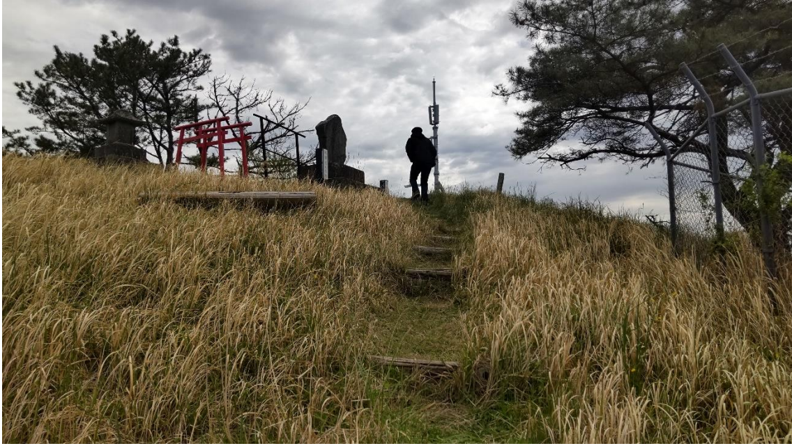
一本道を進んでいくと 9:26