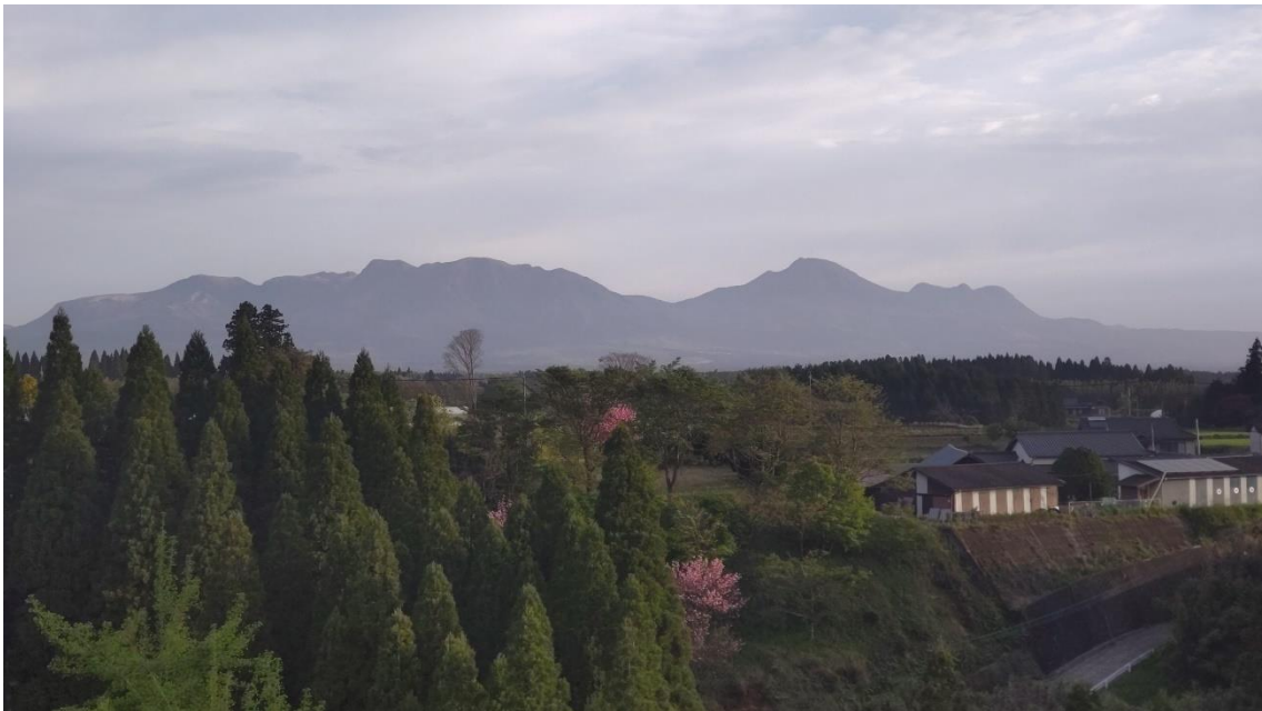
「萩の里温泉」の部屋から一望できるくじゅう連山