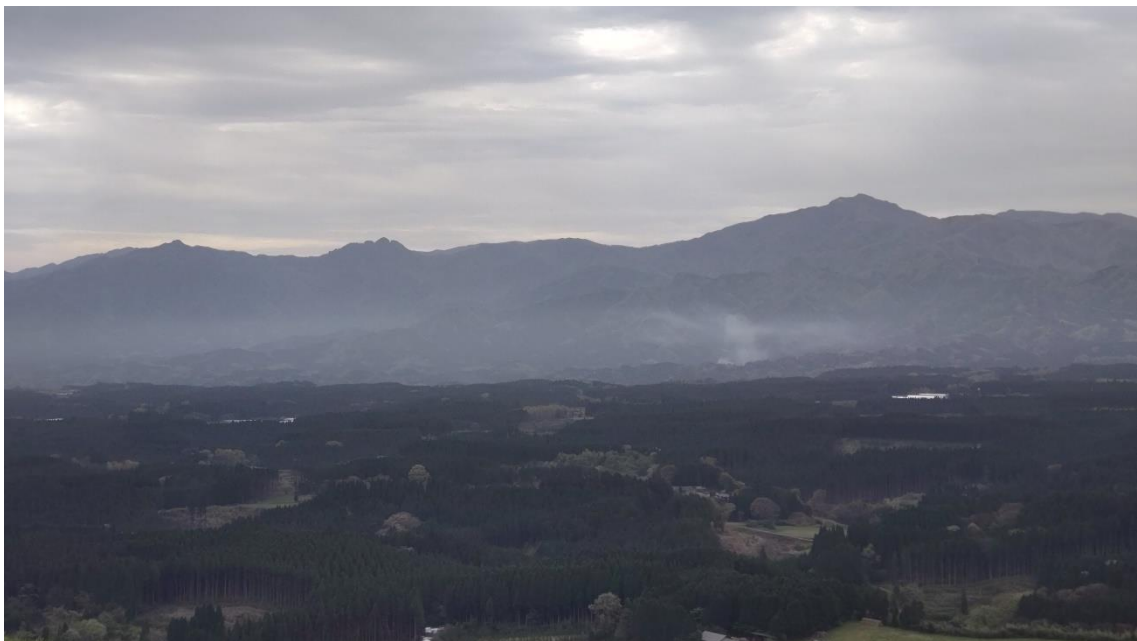
祖母連山 傾山～祖母山の山並み