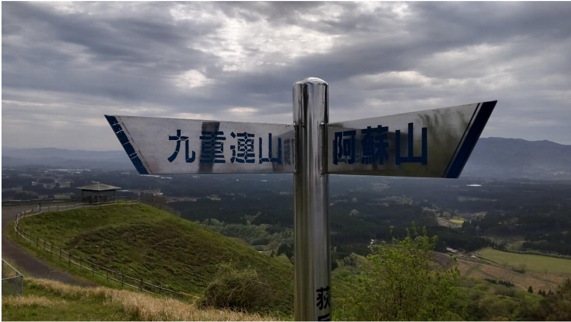
北側にくじゅう連山