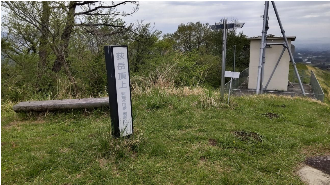
荻岳 山頂 9:27 843m