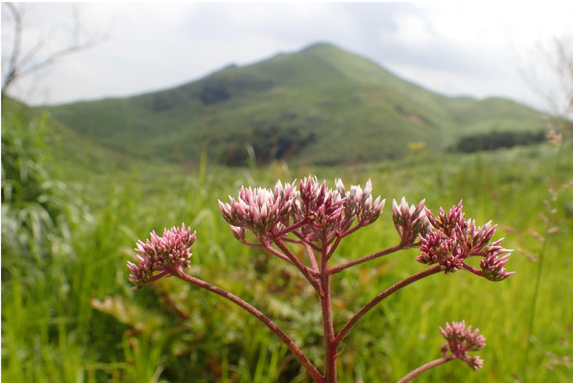
サワヒヨドリ(広谷湿原にて)