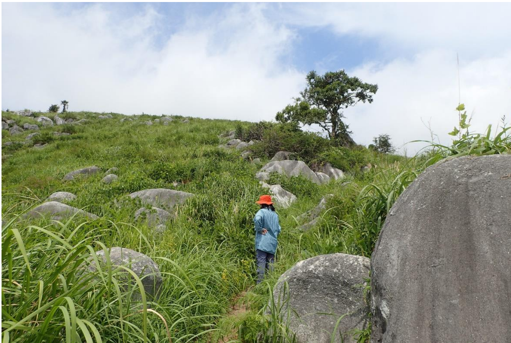
鉄管道を散策しながら上る 12時14分