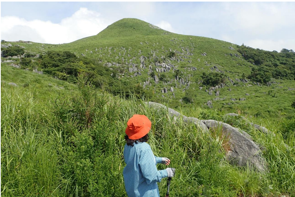
権現山を見上げる 14時24分