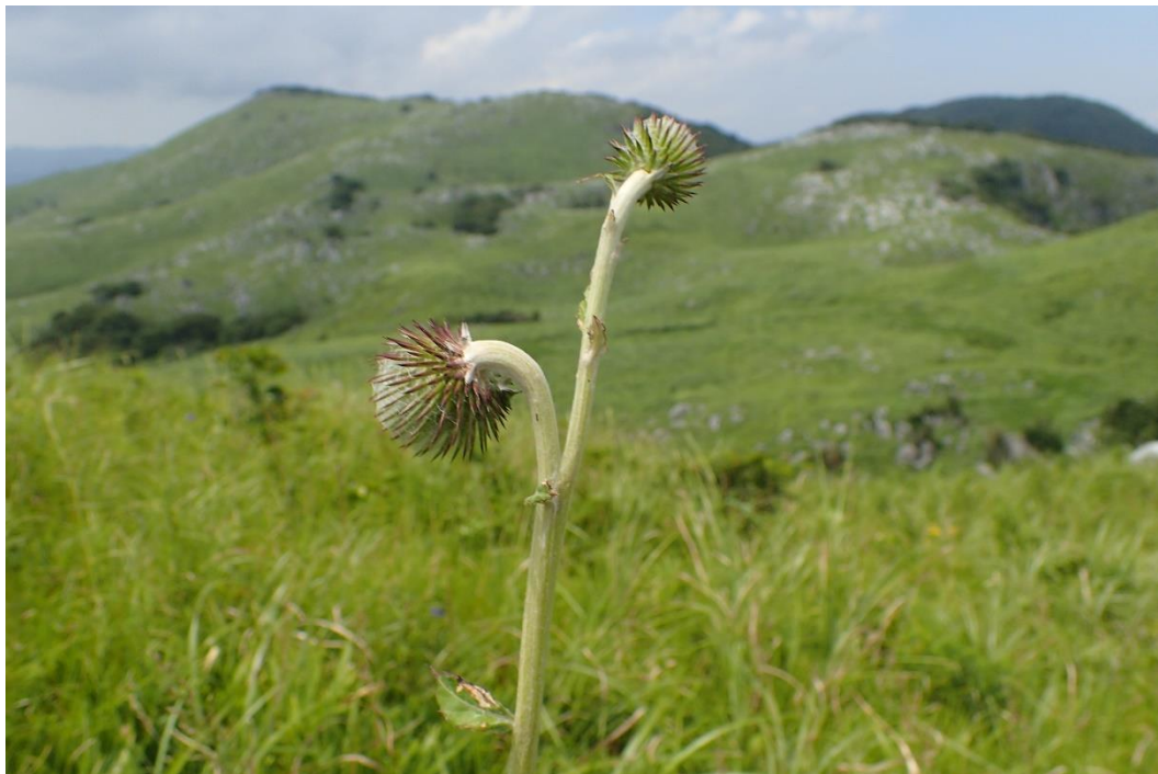
ハバヤマボクチ 12時49分