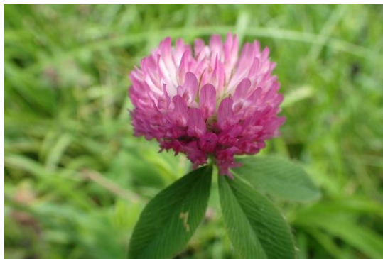
ムラサキツメクサ