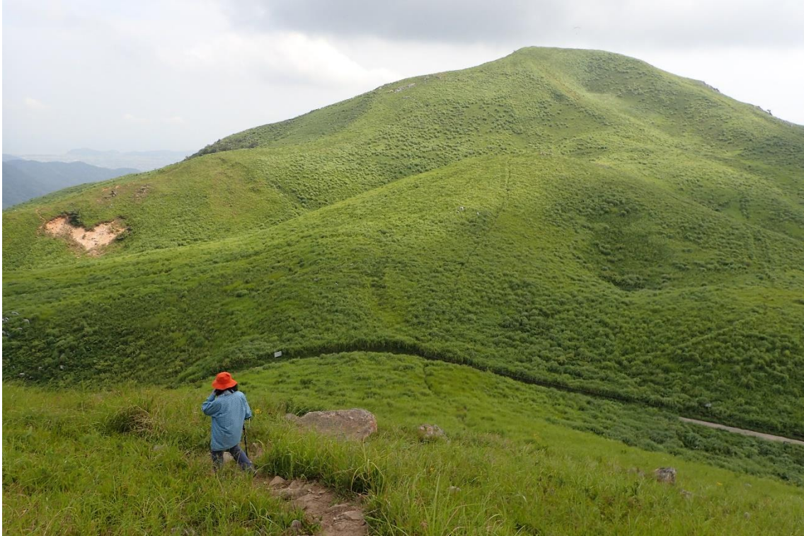
周防台を正面に見ながら下る 13時29分