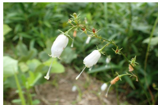
シロバナサイヨウシャジン