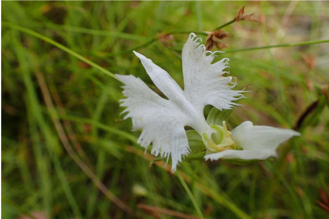
サギソウに出逢えて満足