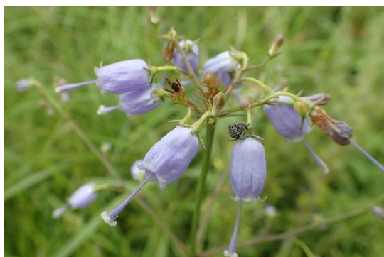
サイヨウシャジン